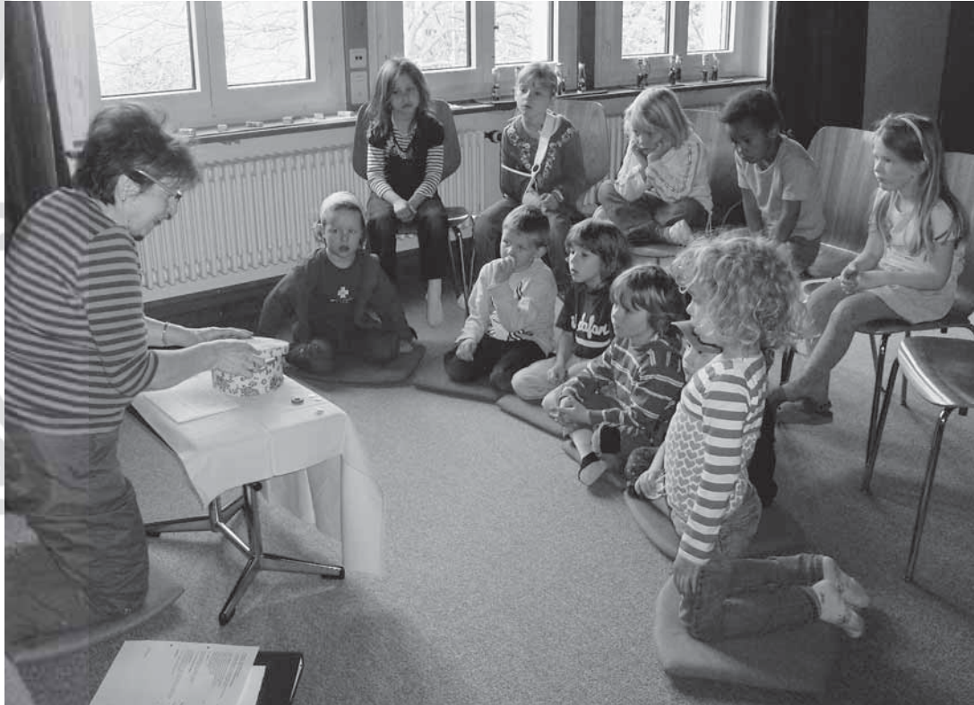
Evangelisch-reformierte Kirchgemeinde Wallisellen, rund 4430 Mitglieder, www.zh.ref.ch/wallisellen