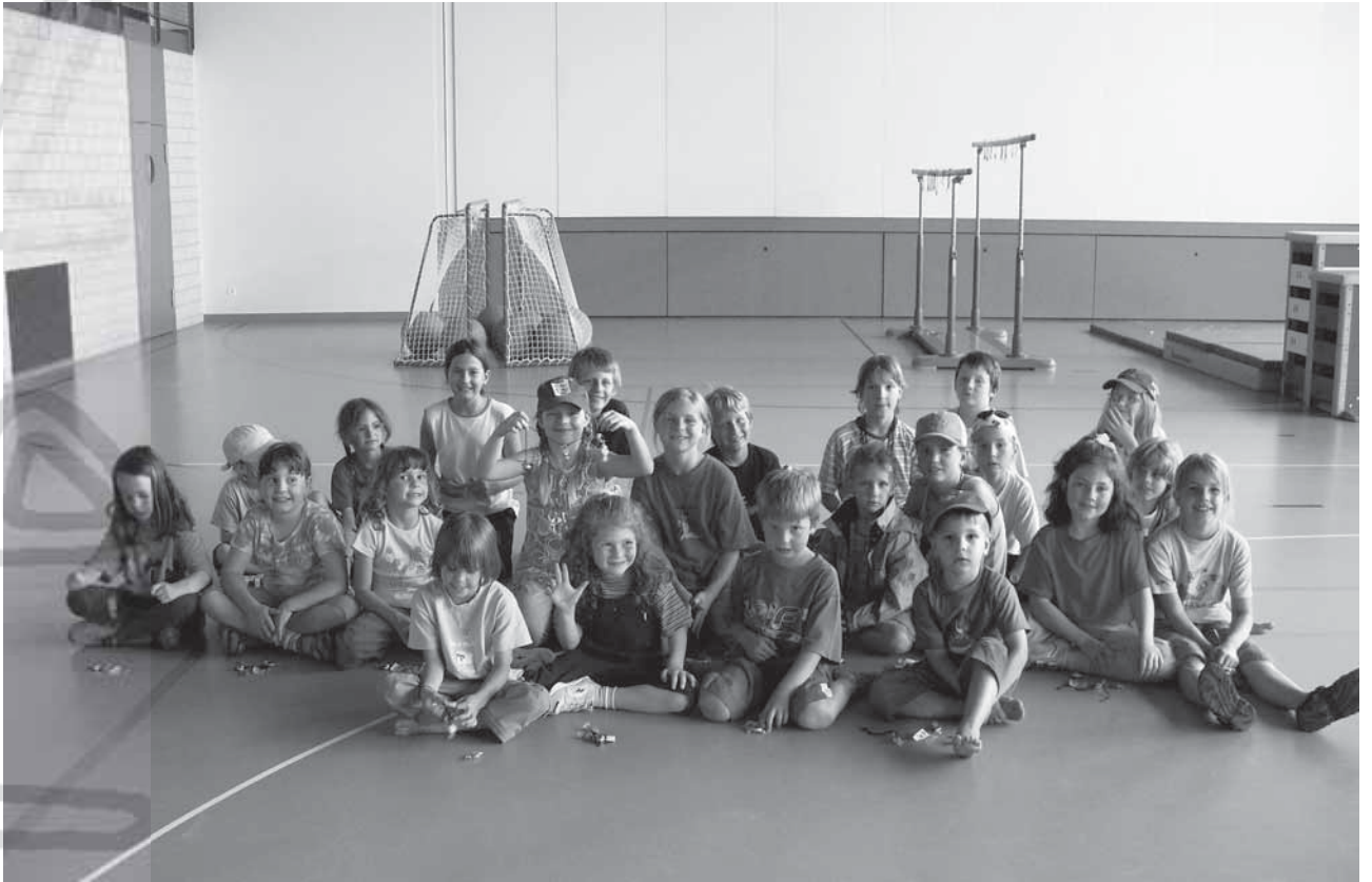
Evangelisch-reformierte Kirchgemeinde Hettlingen, rund 1700 Mitglieder; www.ref-hettlingen.ch