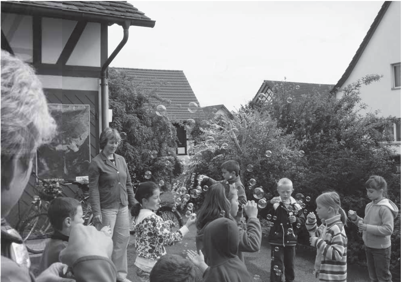
Evangelisch-reformierte Kirchgemeinde Ossingen, rund 870 Mitglieder