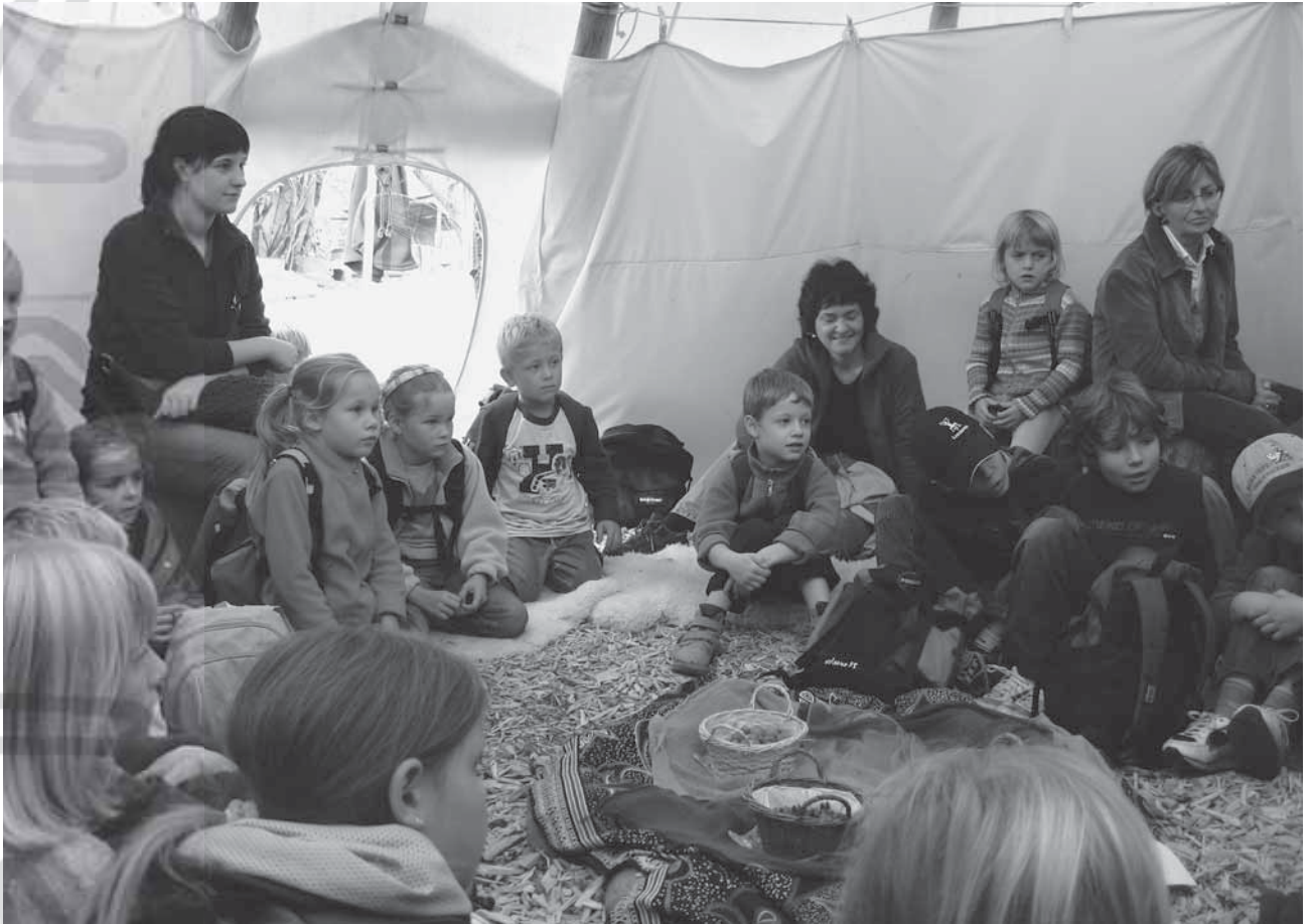
Evangelisch-reformierte Kirchgemeinde Pfäffikon, rund 4770 Mitglieder