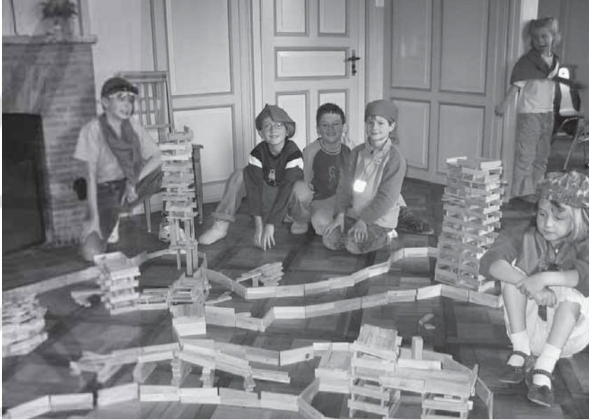
Evangelisch-reformierte Kirchgemeinde Richterswil Samstagern, rund 4500 Mitglieder